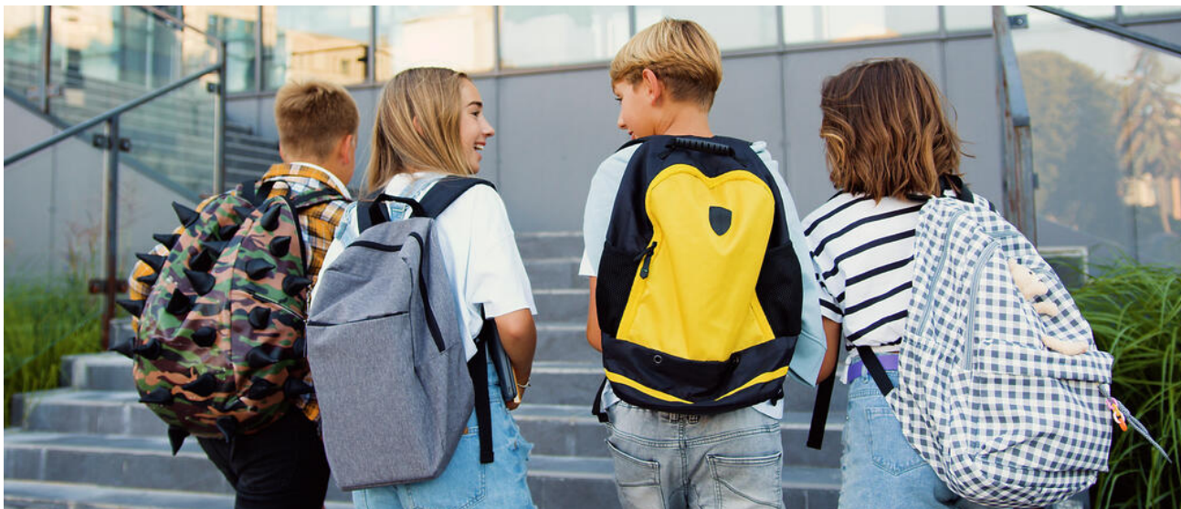
Im modularen bayerischen Schulsystem stehen viele Wege offen